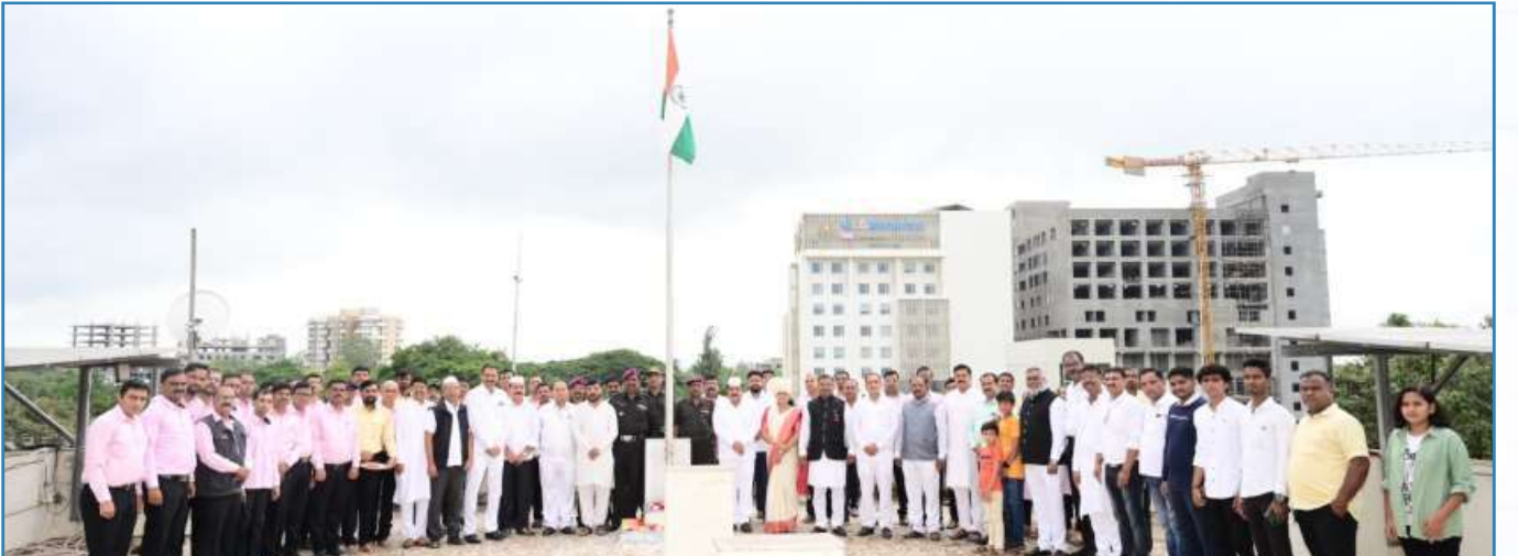
१५ ऑगस्ट स्वातंत्र्य दिनी ध्वजारोहन करतांना अध्यक्ष, उपाध्यक्षा, संचालक, सभासद व अधिकारी, कर्मचारी वृंद