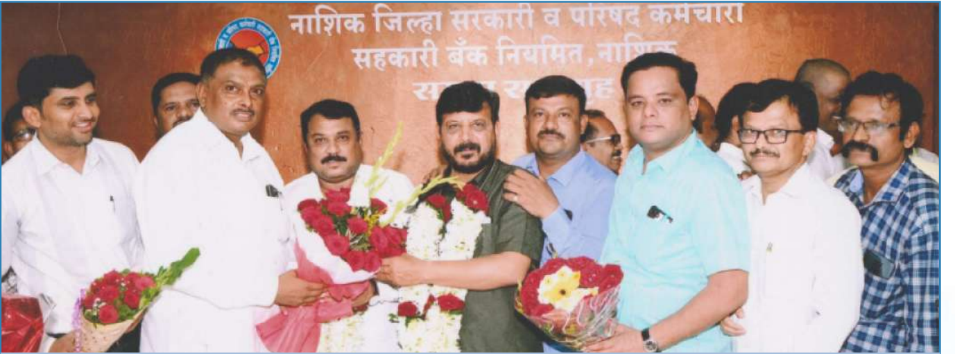
मा.अध्यक्ष व मा.उपाध्यक्ष निवडी प्रसंगी अभिनंदन करतांना सन्माननिय सभासद