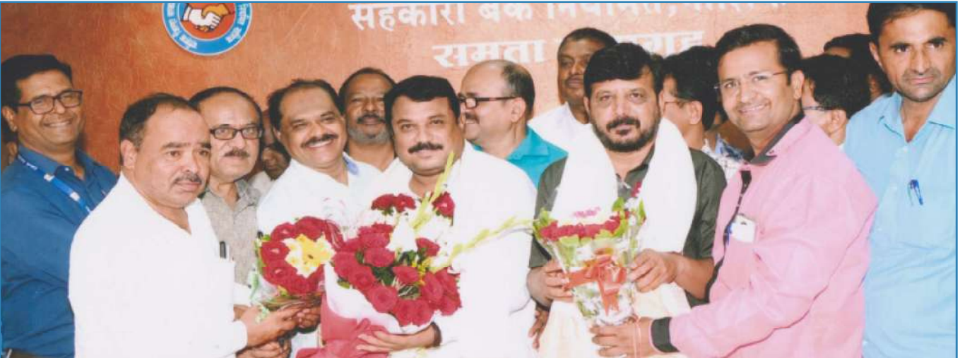
मा.अध्यक्ष व मा.उपाध्यक्ष निवडी प्रसंगी अभिनंदन करतांना सन्माननिय सभासद