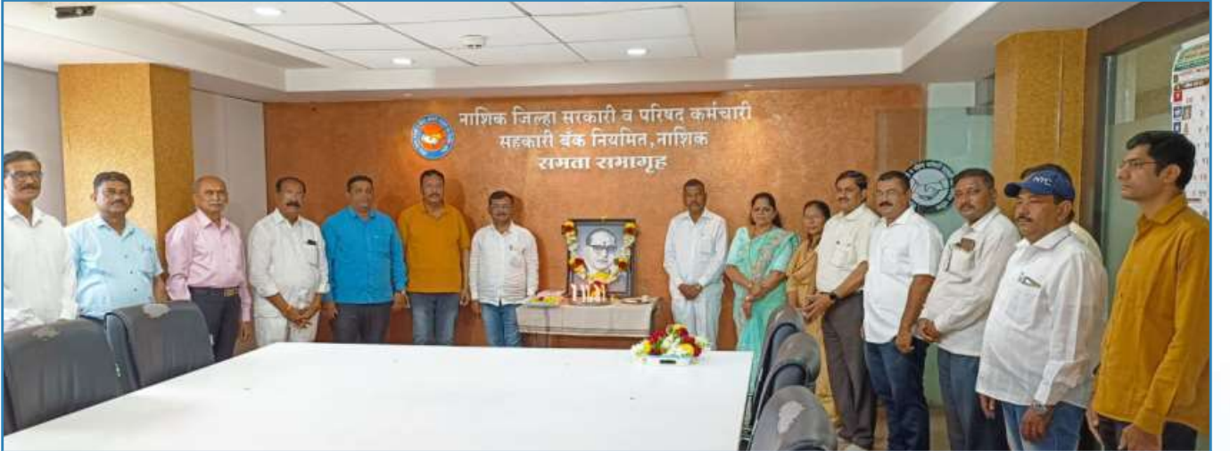
भारतरत्न डॉ.बाबासाहेब आंबेडकर जयंती निमित्त प्रतिमा पुजन करतांना तत्कालीन अध्यक्ष, उपाध्यक्षा, संचालक, सभासद व अधिकारी