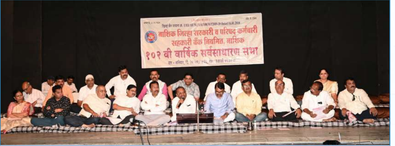
बँकेच्या १०२ व्या वार्षिक सर्वसाधारण सभेत माहिती देतांना तत्कालीन अध्यक्ष व संचालक मंडळ सदस्य