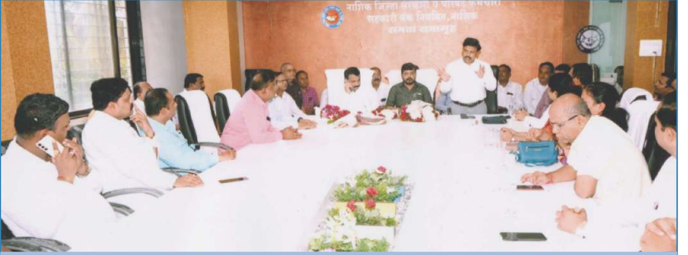
मा.अध्यक्ष व मा.उपाध्यक्ष निवडी प्रसंगी मागदर्शन करतांना मा. निवडणुक निर्णय अधिकारी