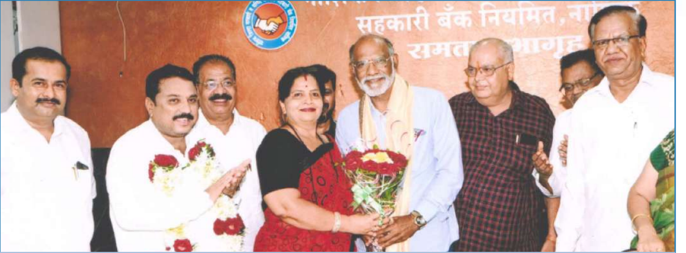
मा.अध्यक्ष व मा.उपाध्यक्ष निवडी प्रसंगी मार्गदर्शकांचा सन्मान करतांना परिचारीका संघटनेच्या राज्य अध्यक्षा