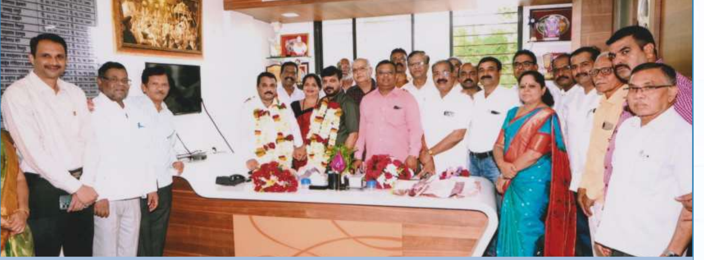
मा.अध्यक्ष व मा.उपाध्यक्ष निवडी प्रसंगी अभिनंदन करतांना संचालक मंडळ संदस्य व सन्माननिय सभासद