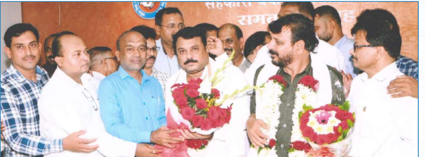
मा.अध्यक्ष व मा.उपाध्यक्ष निवडी प्रसंगी अभिनंदन करतांना सन्माननिय सभासद