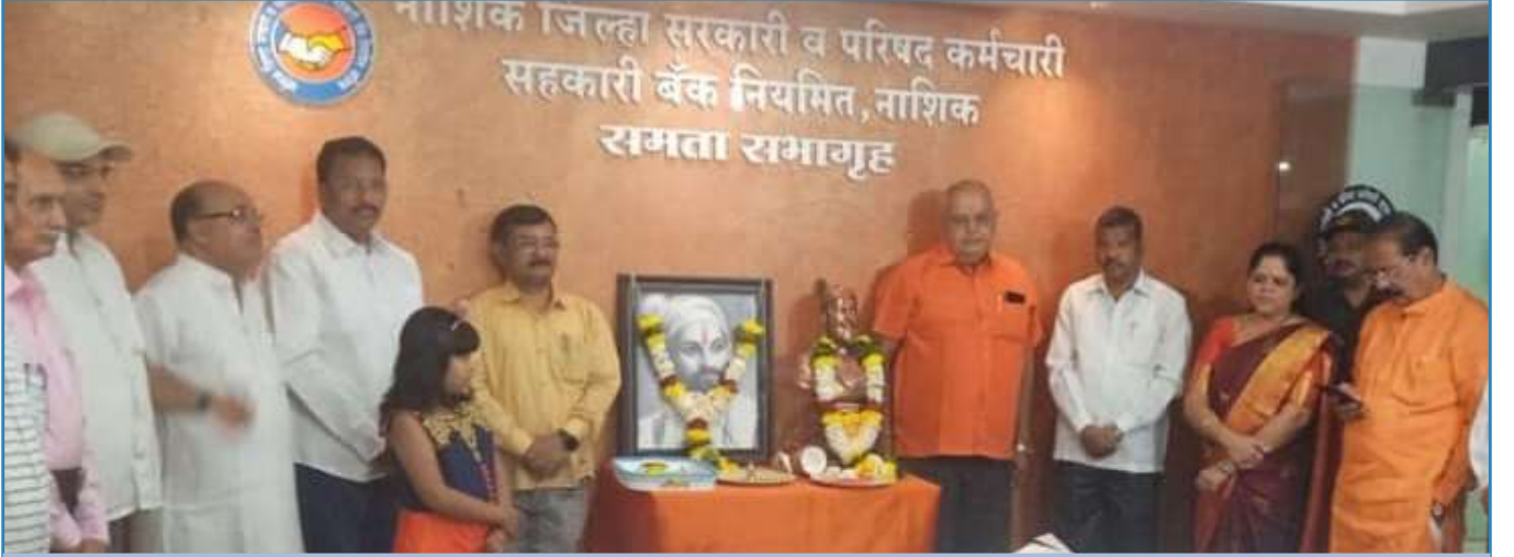
छत्रपती शिवाजी महाराज जयंती निमित्त प्रतिमा पुजन करतांना तत्कालीन अध्यक्ष, उपाध्यक्षा, संचालक व अधिकारी कर्मचारी वृंद